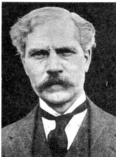
Ramsay Mac Donald, der neuergewählte englische Ministerpräsident.

Der neue Kurs in England ist vom Außenminister Henderson, der mit MacDonald und Herriot im Jahre 1924 einer der eifrigsten Apostel des internationalen Friedens und des Aufbaues war, skizziert worden. Seine außenpolitischen Etappen und Ziele sind: Aktivierung der Völkerbundstätigkeit (statt wie bisher Hemmung), Verwirklichung des Kelloggpatentes, lokale Anwendung des neuen Reparationsvertrages, Räumung der Rheinlande, Förderung des Abrüstungsplanes, Wiederaufnahme der politischen und wirtschaftlichen Beziehungen mit Rußland. Die letzte Absicht wird erleichtert durch den günstigen Bericht der Studienkommission, die vor den Wahlen heimgekehrt ist. Innenpolitisch steht an der Spitze die Sanierung der Wirtschaft durch Rationalisierung der Industrie und durch Lösung des Arbeitslosenproblems. Entscheidend für den Erfolg ist dabei, daß die neue Regierung nicht ein radikales Parteiprogramm, sondern ein soziales und wirtschaftliches Reformwerk verwirklichen wird, wofür der Großteil des Volkes und der gegnerischen Presse den guten Glauben und die Bereitwilligkeit des Helfens aufbringt. MacDonald kann unter einem sehr gün-