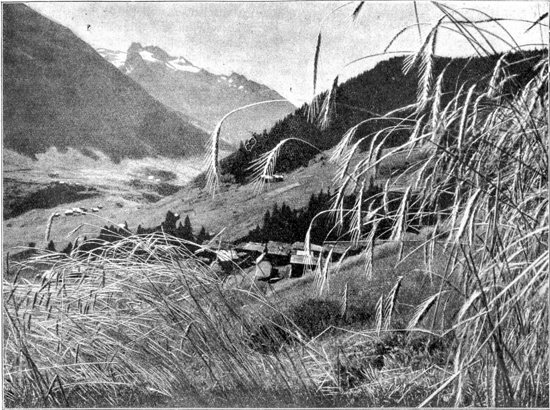
Im Bündner Oberland.

entschied sich sein zerquältes moralisches Gefühl endlich fürs Weiterleben. Nein, seine Ehre war noch nicht das, was der Gildenapfelsche Grimm über die fehlgeschlagenen Berechnungen daraus machen wollte. Er konnte, wenn er ihr Ausgleiten durch die männliche Tat der nachträglichen Anzeige gut machte, nach wie vor unter seinen Amts- und Standesgenossen das Haupt hoch tragen. Nur auf diese Weise konnte frische, gesund machende Luft in die zum Ersticken unerträglich gewordene Atmosphäre der eigenen Familie kommen — wenn sie mit ihrer Schärfe auch bis auf die Knochen schnitt. Dies mußte auch seine Frau einsehen. Sie würde es auch einsehen, sobald sie nur der unabänderlichen Tatsache gegenüberstand.