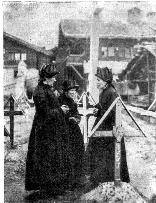
Löttschental. Im Friedhof von Kippel.

Zum erstenmal kommst du hieher, — irgendwo her aus lautem Tal. Im Bahnwagen warst du noch selber so laut und übermütig und dann stiegst du in Goppenstein aus und wandertest das schöne Bergsträßchen nach Kippel hinauf. Da kommt etwas Seltsames dir entgegen. Was ist es nur? — Du findest es nicht gleich. Ist es das Marienbild im Felsen am Weg? Madonnen hast du doch schon viele ge- sehen, prunkvolle und halbzerfallene, leuchtend sich abhebend von südlich blauem Himmel, und du freustest dich auf jeden neuen Marienaltar, weil das alles, mit den vielen farbigen Blumen, die fromme Hände darauf gehäuft, so kindhaft froh und festlich aussah. — Also die Maria ist es nicht, die dir