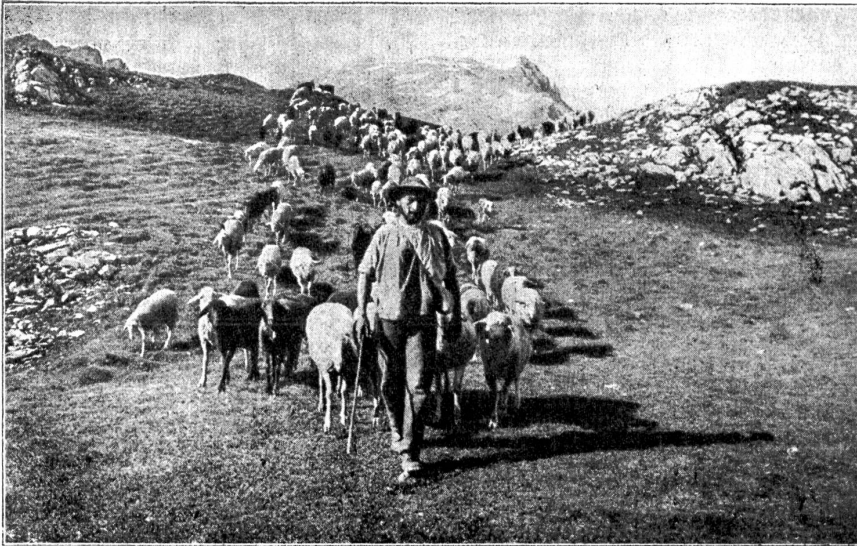
Aus „Schweizer Volksleben“: Schafherde zieht von Alp zu Alp.