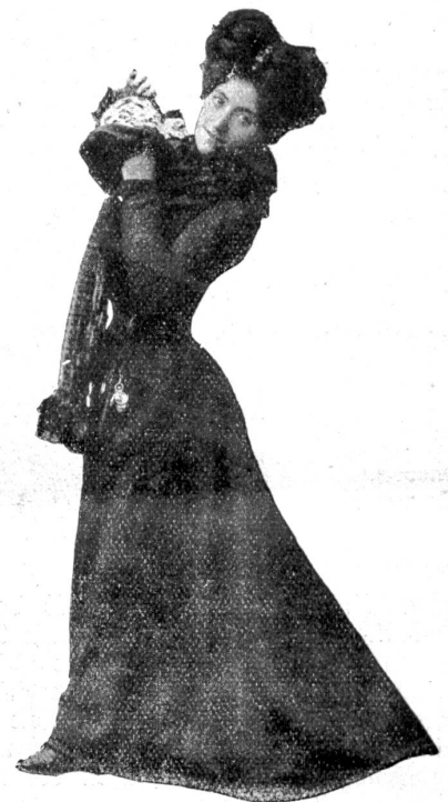
Mode gegen Ende des vorigen Jahrhunderts.