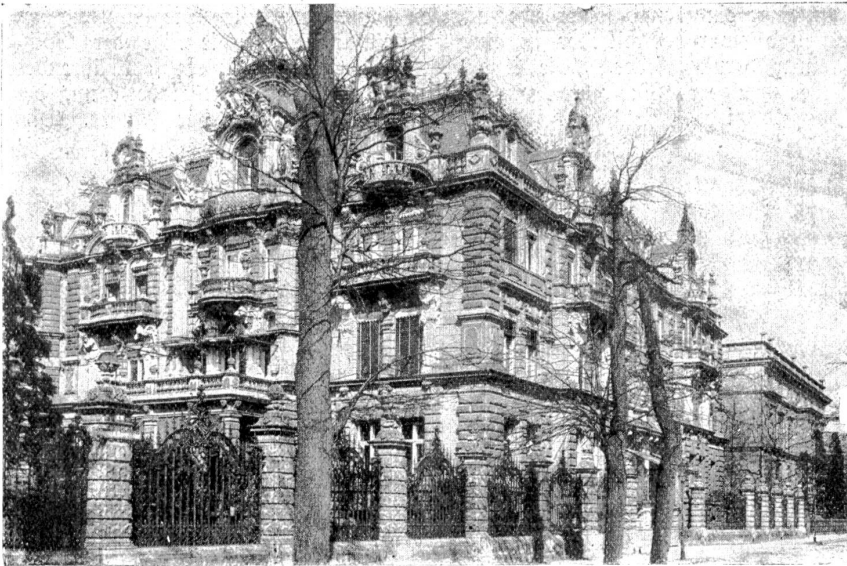
Architektur gegen Ende des vorigen Jahrhunderts.

dem kindlichen Gedankenkreis geübt werden. Ganze Häuserreihen mit ihrem Auf und Ab der Dächer läßt das Kind auf seiner Schiefertafel oder auf dem Zeichnungsblatt entstehen, das Gesicht des Mondes oder eine Kollispielfahrt muß herhalten zum Ueben der Bogen. Und kommen nachher die Buchstaben an die Reihe, so steht das Kind vor keinen zu großen Schwierigkeiten; denn die Elemente brauchen bloß zusammengefügt zu werden, und die Kerle stehen da in ihrer unbeugbaren Eindeutigkeit.