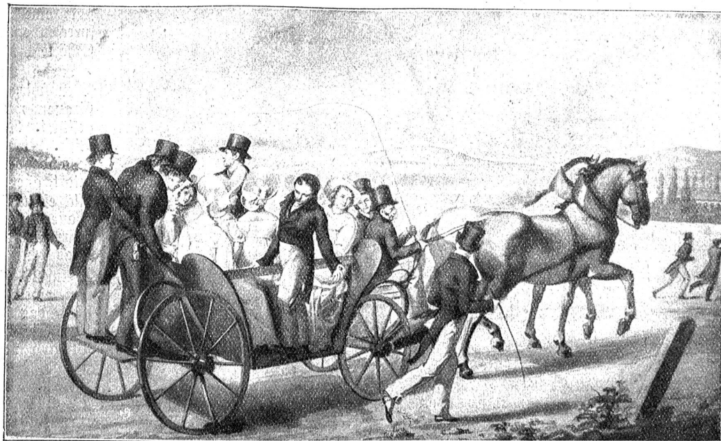
Landpartie Schuberts und seiner Freunde (Schubert links zu Fuß). — Aquarell von Kupelwieser.

Doch allmählich lichteten sich die Reihen der Schubertianer. Bald der eine, bald der andere drückte dem Meister die Hand zum Abschied. Einige verwandelten sich