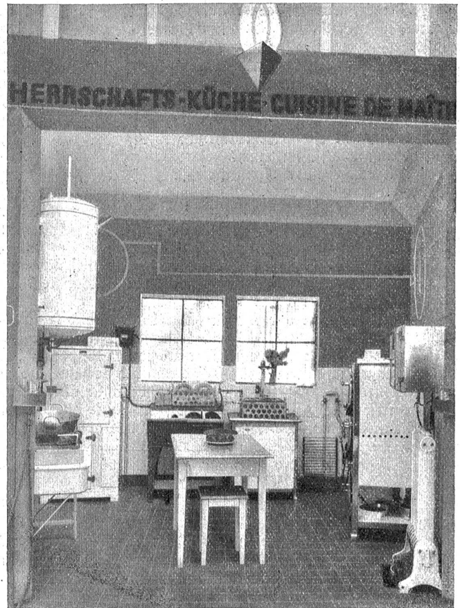
Herrschafts-Küche. Gas-Kochherd, Gas-Breheleisen, Gas-Kaffeeröst-Apparat, Gas-Grill, Gas-Radiator, Gas-Heizofen, Gas-Wärmeofen, Gas-Kühlschrank, Gas-Geschirr-Spülkombination.

Wie man das Baden im Gasbadofen besorgt, vernimmt man gleich von der freundlichen Demonstrationsdame im ersten Raume, der eine gutbürgerliche Küche darstellt. Nicht jede Frau weiß, daß man den Kuchen auf der untersten Rille, direkt über dem Feuer bäckt den Gleichschwer in der Mitte, die Weiden und Zupfen in starker, aber kurzer Hitze usw. So zu lesen im Büchlein, das einem in die Hand gedrückt wird und wo alles Wissenswerte über das Baden im Gasherd geschrieben steht. Wir konstatieren etwas erstaunt, daß zur Ausstattung einer bürgerlichen Küche auch ein mit Gas betriebener Eisschrank gehört, Anschaffungskosten zirka