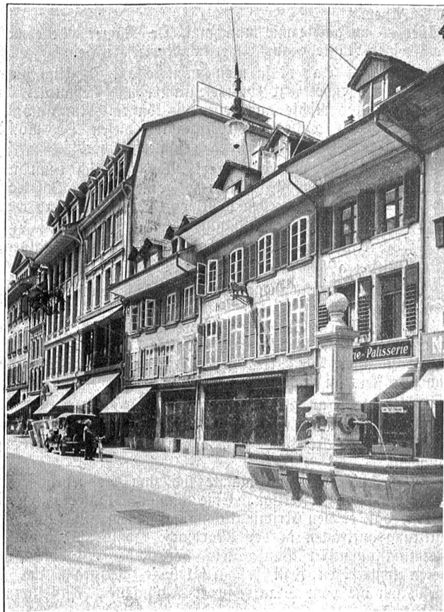
Das bisherige Hotel Löwen gegen die Schaulplatzgasse.

Die alte Frau sah hilflos auf den Richter. „Er will aber ja Beweise haben.“