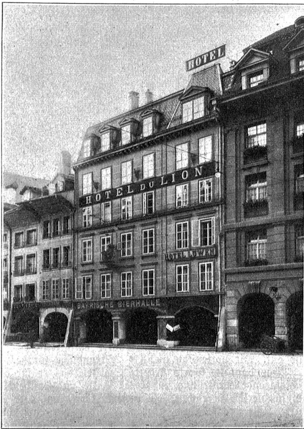
Das bisherige Hotel Löwen gegen die Spitalgasse.