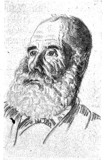
Charakterköpfe aus dem Lauenentälchen. Zeichnungen von U. W. Züricher in Em. Sriedl's „Saanen“, Verlag A. Francke A. G. Bern.

tälchen. Wehe uns Menschen der Tiefe, wenn die Fluten der städtischen Kultur dort hinaufsteigen und die naturgewordene Eigenart, die Schlichtheit und Frömmigkeit wegschwemmen! Dr. Emanuel Friedli möchte mit seinen „Bärndütsch“-Büchern Dämme bauen gegen diese Fluten. Die Fülle von heimatkundlichen Tatsachen in diesen Büchern soll uns Respekt einflößen vor dem Gewordenen. Sein „Saanen“-Band stellt sich wie ein treuer Hüter auf vor die Talschaften des sonnigen Saanenlandes. Seine besondere Liebe hat er dem