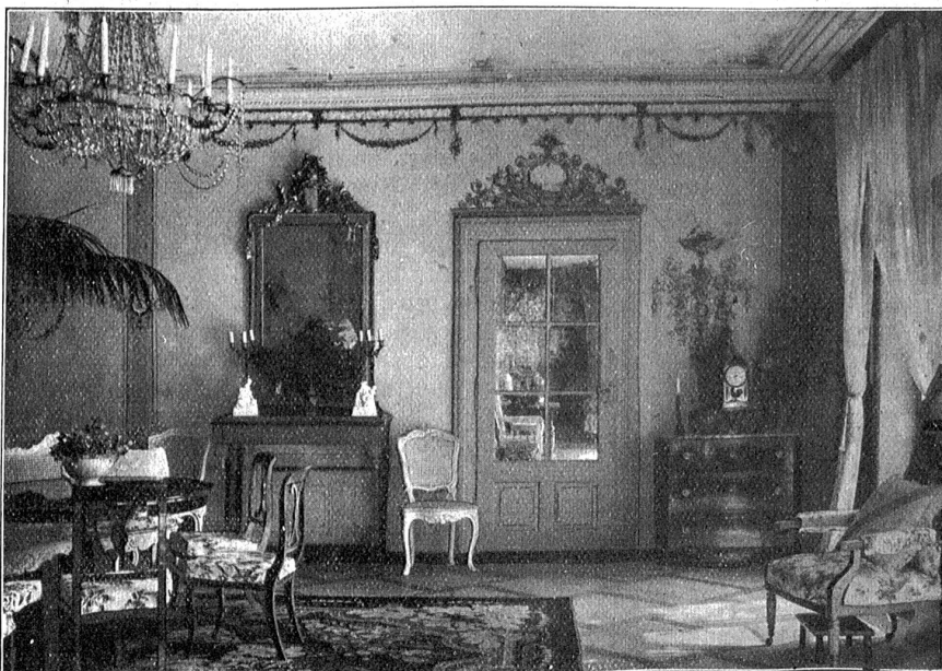
Landhaus Märchligen. — Salon.