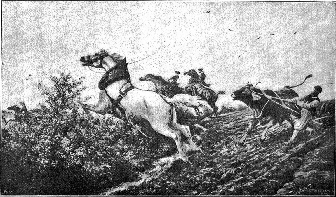
Rudolf Koller: „Alte Erinnerungen“.

das schöne, bekannteste und am meisten reproduzierte Bild „Die Gotthardpost“, das uns Kollers Können in glänzendstem Lichte zeigt. Ein neues Augenleiden setzte 1875 der Arbeit neuerdings Grenzen. Aber Koller ließ sich nicht unterkriegen. Die verminderte Sehkraft hinderte ihn zwar in Zukunft am Malen im Freien, eine harte Nuß, war er doch gewohnt, nur nach der Natur zu schaffen. Aus dem Gedächtnis und nach flüchtigen Skizzen entstand indes noch manch' feines Werk, vielleicht in der Zeichnung etwas weniger exakt als früher, aber von leuchtender Farbenkraft. An Ehrungen fehlte es nicht. München überreichte ihm eine Medaille, ebenfalls Paris. Er wurde Mitglied der eidgenössischen Kunstkommission. Die Kunstvereine Basel und Luzern ernannten ihn zum Ehrenmitglied, die Zürcher Universität zum Doktor philosophiae honoris causa. Die großen Festlichkeiten von 1898 anlässlich des 70. Geburtstages zeugten von der Wertschätzung in der engeren Heimat.