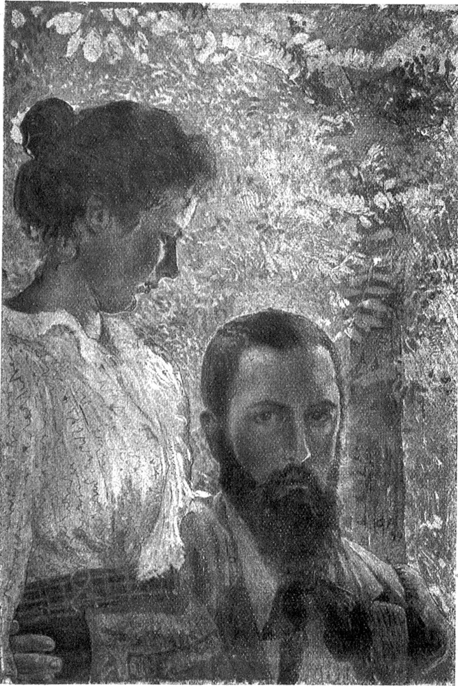
Cuno Amiet: Doppelbildnis (Der Maler und seine Frau 1899).