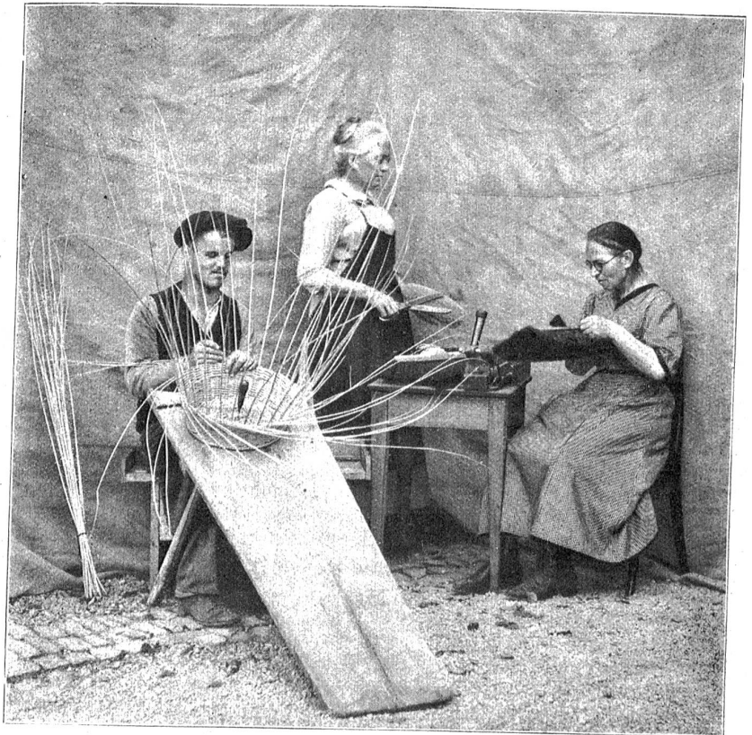
Vom Blindenheim Bern. — Beim Korbflechten und Bürstenbinden.

Also ist Karol nach Wien gefahren, ohne sie vorher zu benachrichtigen! Und wann? Und warum ist es denn so plötzlich abgereist? Und was schreibt er?