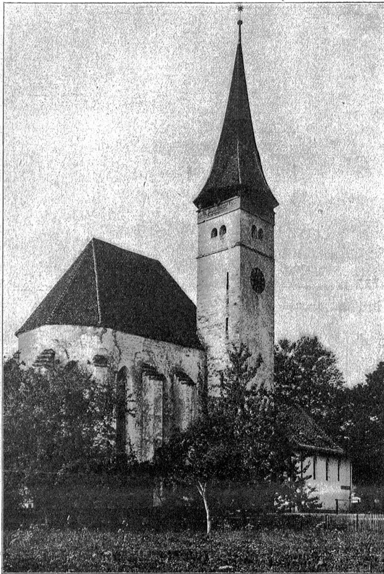
Die Augustiner-Klosterkirche von Interlaken. Aufgenommen vor ihrem Umbau 1910/1911.