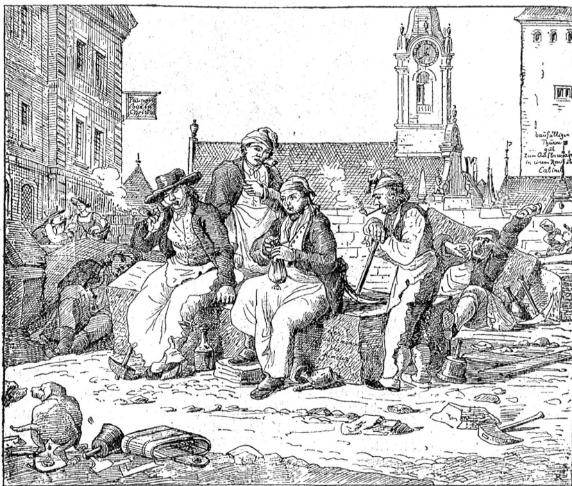
Die fleißigen Steinmehlen des hochadeligen Bauamtes einer Stadt Bern, 1802.

Nach der Heimkunft der Banner kamen auch Bottschaften aus Luzern, Uri, Zug, Schwyz und Wallis, die die Unterwaldner zu entschuldigen suchten und meinten, „Es wolten die von Bern vergangene Sachen nicht so hoch aufnehmen“. Daraufhin erhielten denn auch die Leute von Hasle und die Interlatner ihre Banner und Freiheiten zurück. Im ganzen wurden überhaupt nur vier Rädelsführer enthauptet, viele aber waren geflohen und wurden ihre Güter eingezogen, was der Chronist am Schlusse seines Berichtes so nebenbei erwähnt.