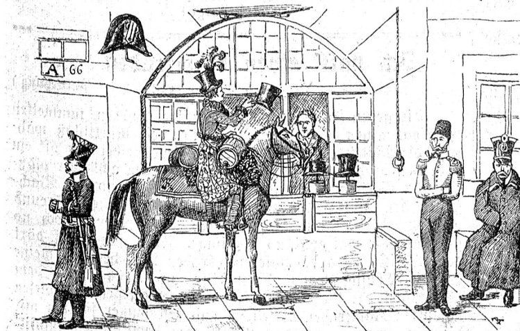
Oesterreichische Marketenderin vor dem Hutladen Staub am Stalden 1815.

Die Anforderungen, an das weibliche Dienstpersonal besonders, waren höher als heute im Zeitalter der Spezialisierungen; eine Perle nach den Anforderungen von Nr. 2 wäre jetzt kaum mit Gold aufzuwägen. Auch der Melker in Nr. 4, der zugleich käsen kann, ist in unsern Tagen eine Seltenheit ersten Ranges; dabei ist aber zu bedenken, daß der ganze Kanton damals erst zwei oder drei Tälkälereien hatte. Unter den „Hinterlagen“ der Kellermägde sind Kauttionen zu verstehen.