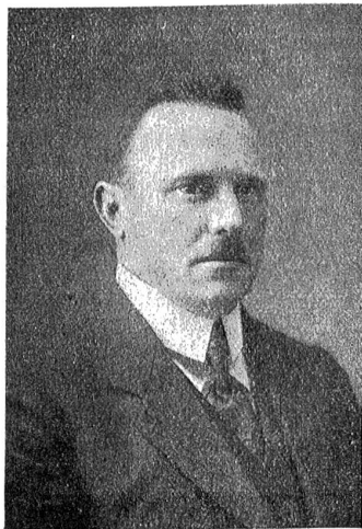
Rudolf Winger, der neugewählte Nationalratspräsident.

In der ersten Sessionswoche des Nationalrates gelangte die Kurzaalinitiative als erstes Traktandum zur Verhandlung. Nach Anhörung von 24 pro und kontra Rednern wurde schließlich in namentlicher Abstimmung die Initiative mit 110 gegen 53 Stimmen gutgeheißen und ein Bundesbeschluss gebilligt, nach welchem die Kantone den Betrieb der 1925 üblich gewesenem Unterhaltungspreise gestatten können, sofern dieser zur Erhaltung oder Förderung des Fremdenverkehrs notwendig erscheint. Der Einsatz darf aber 2 Franken nicht überschreiten und jede kantonale Bewilligung unterliegt der bundesrätlichen Genehmigung.