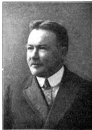
Dr. Emil Savoy, der neugewählte Ständeratspräsident.

Der Bundesrat schlägt eine Abänderung des Auslieferungsgesetzes vor, wonach unter die Auslieferungsbefehle auch die vorsätzliche Zuwiderhandlung gegen Vorschriften betreffend Betäubungsmitteln aufzunehmen wäre, sofern die Handlung mit einer Gefängnisstrafe bedroht ist. Anlaß zu diesem Vorschlag gab die jüngst aufgedeckte Affaire der internationalen Opiumbändler, die zugleich in mehreren Staaten, darunter auch in der Schweiz, tätig waren. — Er unterbreitet den eidgenössischen Räten eine Botschaft mit dem Antrag auf Erteilung einer Konzession für eine elektrische