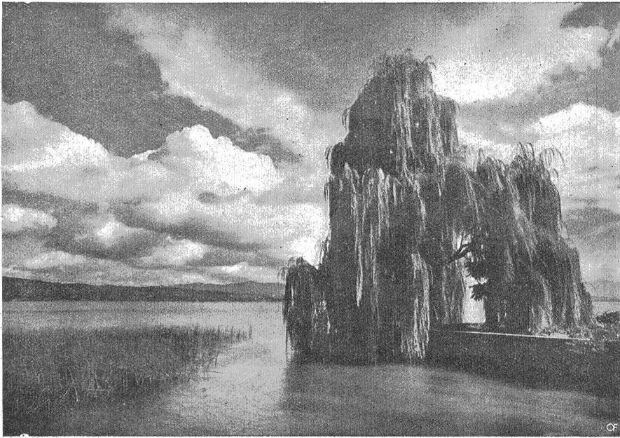
Am Zürichsee.

Seemauer und schaute in die Nacht hinaus. Weithin dehnte sich die Bucht. Die Ufer waren anzuschauen wie zwei lange, mit tausend gelben Lichtpünktchen besetzte, schwarze Arme, welche den See umfakten. Nur oben mochten sie nicht zusammen. Dort träumten ferne, blaue Berge in Nebeldunst. Der Mond stand blank und voll am Himmel und goß in verschwenderischer Fülle sein bleiches Licht auf Land und Wasser aus. Der See war verschlossen, weder Haus noch Himmel spiegelte er. Wie flüssiges Blei bewegten sich die Wellen auf und ab. Eine schöne, gelblichweiße Straße malte der Mond auf dem Rücken des Sees, die funkelte wie Gold und Silber. Weit, weit hinauf in den See führte sie, wurde immer schmaler und schmaler und hörte irgendwo im Dunkel auf. Wo fing sie an? Meine Blicke glitten auf ihr abwärts. Schon am Ufer glückerten die ersten Gold und Silberfleden, wie mit feinem Pinsel hingemalt. Ein Liebespärdchen saß auf einer grünen Bank vor dieser goldnen Straße. In-