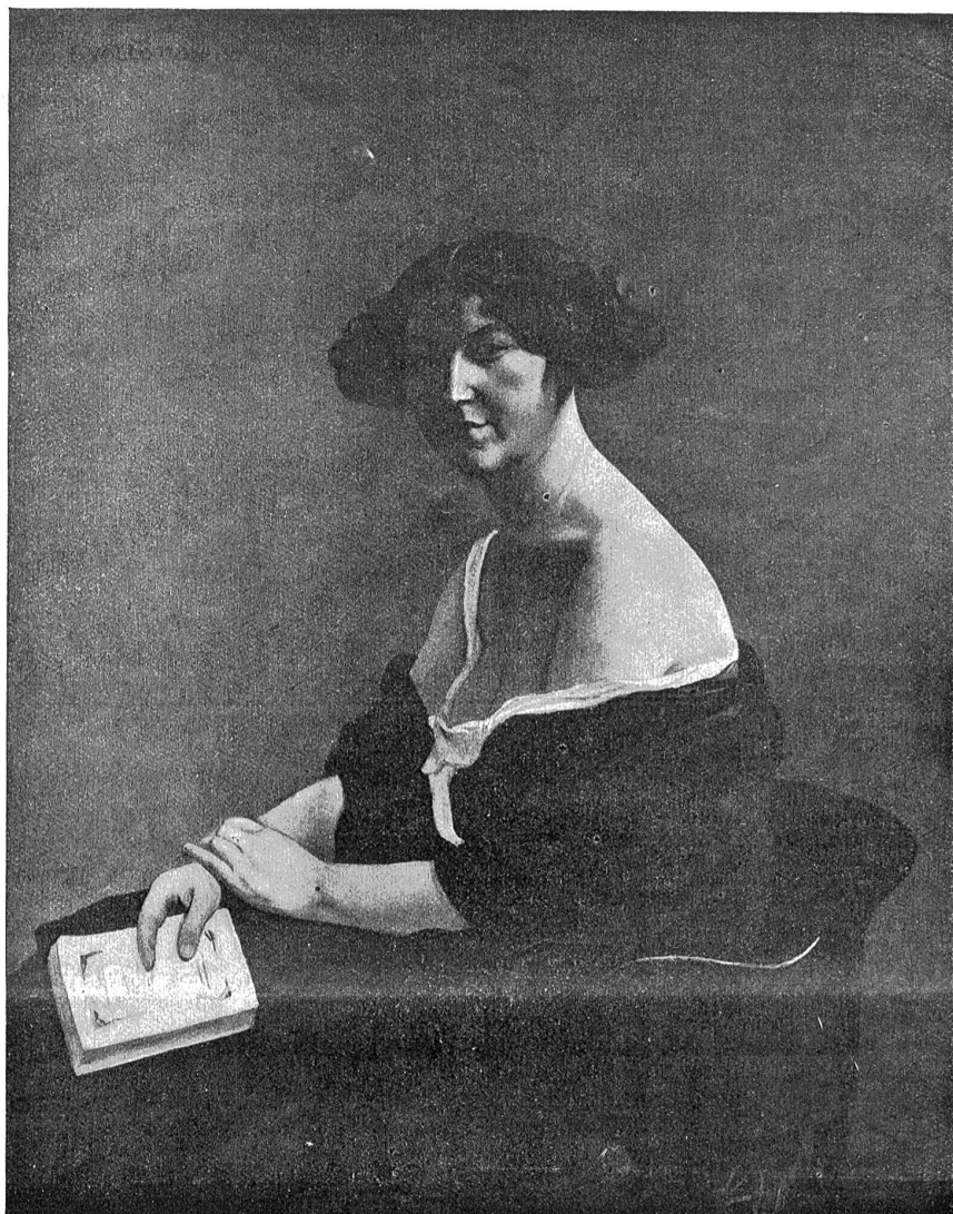
Selix Vallotton: Die Dame mit dem gelben Buch. — (Kollektion P. Vallotton, Lausanne.)

„Und so blieb es; unter ihrer zugleich liebevollen und strengen Pflege ging die Heilung wider mein Erwarten und — trotz des furchtbaren Vergleiches — ich kann dennoch sagen: zu meiner Freude, rasch vorstatten, so daß mir bald