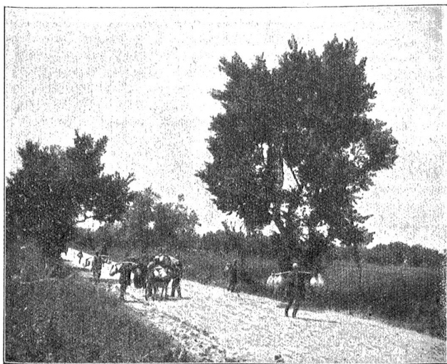
Albanien. Marktbefucher auf der Landstraße Walona-Skala.

Kein edel denkender Mensch wird es sich einfallen lassen, dem Völkerbund entgegenzuarbeiten, solange er der Kriegsverhinderung dient. Jeder Mensch von sauberer Gefinnungsart wird dieser Aufgabe freudig zustimmen. Und jeder sieht ein, daß diese Aufgabe ein paar gute Köpfe und Hände erfordert.