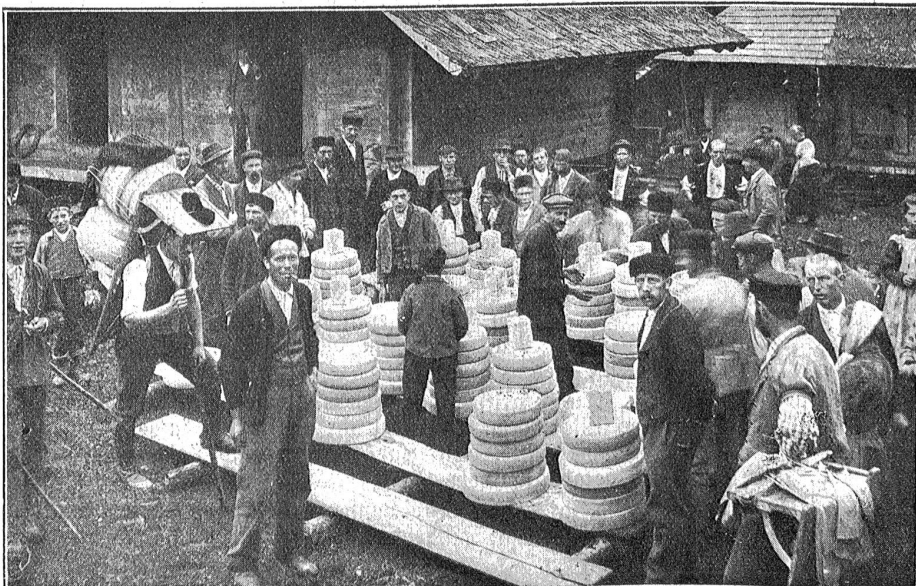
Kästeilet im Jostustal.

Im blauen, kühlen Schatten liegen noch immer die Hütten, die budlige steinige Wiese und die vielen Menschen. Ein geschäftiges Jahrmaktsreiben. Die runden Käsläibe werden sorgsam auf Karren, auf Tragstühle, in Körbe