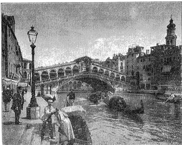
Venedig. — Ponte di Rialto.

Die Bücher nennen Venedig eine Märchenstadt. Maler, Dichter und Musiker waren dort, Dürer, Feuerbach und Richard Wagner, und aus ihren Briefen kann man lesen, einen wie mächtigen Eindruck diese Zauberstadt auf sie gemacht hat. Sven Hedin, der große Reisende, rät: „Wer zum ersten Male Italien besucht, sollte stets mit Venedig, der Heimat Marco Polos, beginnen, und zwar muß er es so einrichten, daß er am Abend dort anlangt. Dann wird sich eine Wunderwelt vor ihm erschließen und er wird glauben, in ein Märchen aus „Tausend und eine Nacht“ versetzt zu sein.“