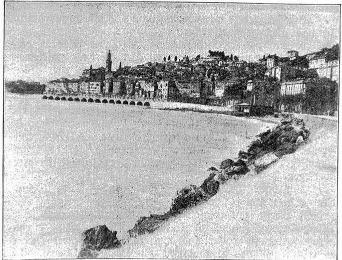
Mentone, die französische Grenzstadt.

Zum schönsten, was die Riviera zu bieten vermag, gehört eine Wanderung von Ventimiglia nach Mentone, dem französischen Grenzort. Die Straße windet sich, stets im Anblick des tiefblauen Mittelmeeres, schroffen Felswänden entlang, aus welchen hellrote und feuerfarbige Pelargonien hängen, Rosensträucher schon im März ihre duftenden Blütenkelche öffnen. Drei Kilometer nach Ventimiglia senkt sie sich in die mit Reben, Riesenölbäumen und Blumenfeldern gesegnete Piano del Vatte hinab, wo die Schüsse abgegeben wurden, windet sich auf der anderen Seite nach dem Dörfchen La Mortola hinauf. Hier muß man den berühmten Garten besuchen, den 1867 Thomas Sanbury anlegen ließ. Die in Kummelstentalk tiefgerissene Schlucht, die den Garten birgt, wird gegen Norden durch den Monte Bellenda geschützt. Das ermöglicht bei künstlicher Bewässerung eine selbst für die Riviera fabelhafte Vegetation. Über 6000 Pflanzen-