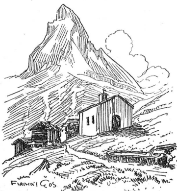
Auf dem Weg nach Sindelen.

Zwei meiner lieben Freunde, ein Künstler und ein Dichter, wußten mir nie genug von Walliser Bergschönheit