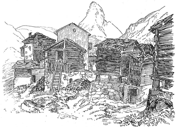
Das alte Zermatt.

Handwerksburschen durch das Wallis ziehen und — kommst du mal ins Vispertal, dann mach die Augen auf und staune.