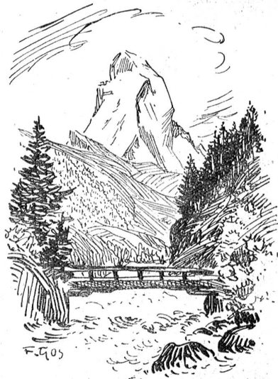
An der Matter-Visp.

Kommst du mit der Berner Alpenbahn von Bern her durch den Lötschberg ins Wallis, so nimmt es dich schon mit seiner wahrhaft heroischen Landschaft gefangen und wenn du Brig und Visp gesehen hast, so weißt du — das ist Wallis. Diese Städtchen im offenen sonnigen Rhonetale vereinigen in sich alles: Sonne, Wein, Berg und Tal, Singen