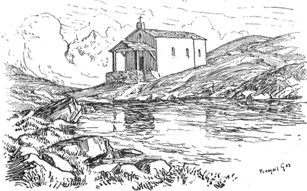
Das Kirchlein Mutter Gottes zum Schnee am Schwarzsee.

da oder dort „zu tun“ hatten, vertrieben sich die andern die Zeit mit Spielen und Herumtollen. Sie hatten einen Anführer, den sie „Chef“ nannten und dem sie strengen Gehorsam leisteten. Sie gingen auf Diebstahl aus und lie-