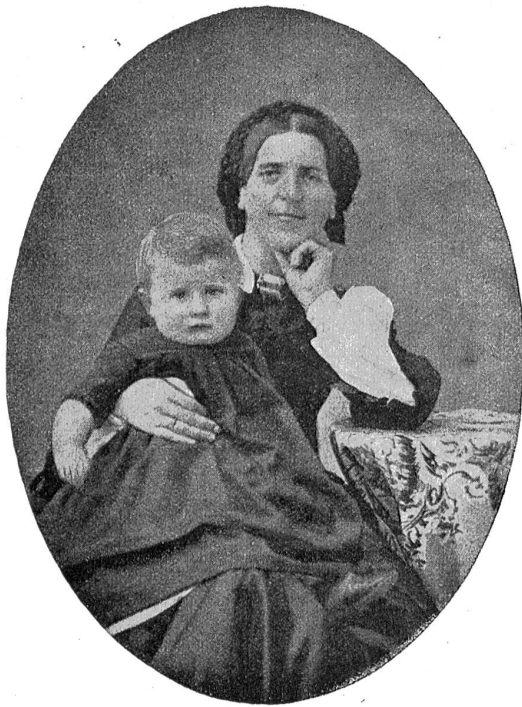
Johanna Spyri als junge Mutter.

nimm dich der Spenglersfrau an, wenn sie in Not kommen soll. Versprichst du's mir?"