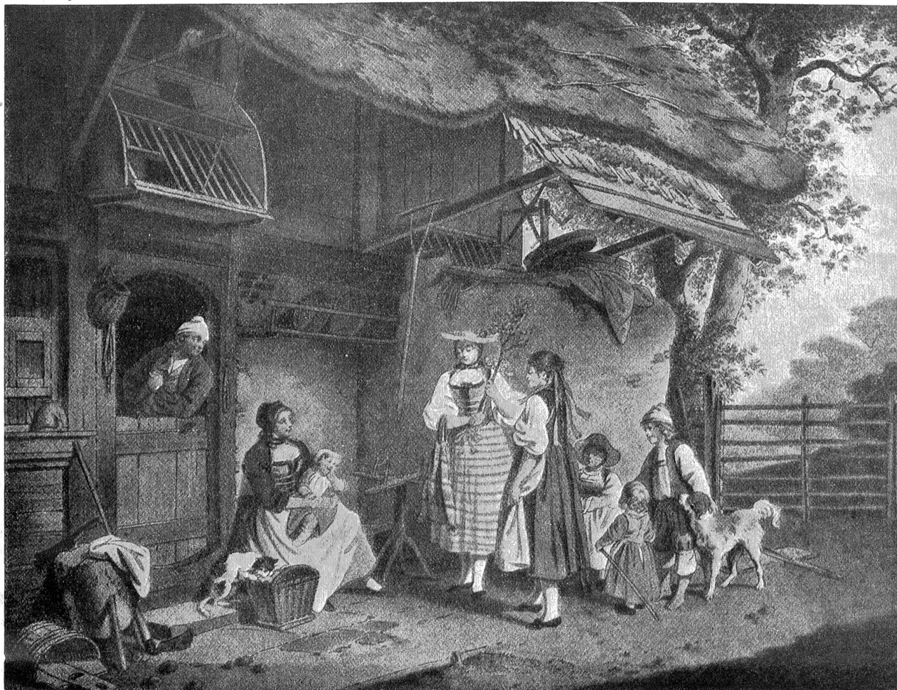
Mäifingen. Von S. Breudenberger.

Einige Forscher glauben den Ursprung dieser Sitte, das Haus zu Pfingsten mit Maien zu schmücken, im uralten heidnischen Baumkultus erblicken zu müssen, der aufkam, als der Ackerbau Eingang gefunden hatte. Da versinnbildlichte wohl das junge Grün die ungeheure Wachstumskraft der Natur.