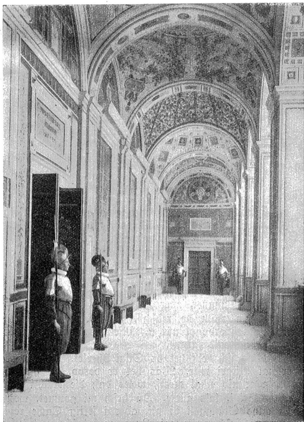
Schweizergardisten beim Wachtdienst.