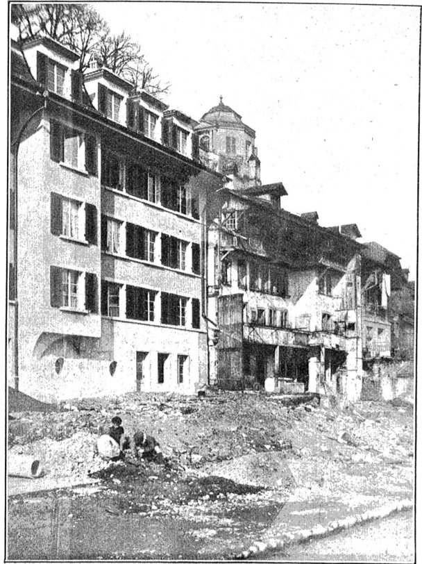
Die Neubauten an der Narstraße-Badgasse.

So viel steht aber fest: Im 14. Jahrhundert hieß der an der Aare gelegene Stadtteil schon die „Matte“. Aareaufwärts, am Fuße der Herrengasse, hießen die Häuser