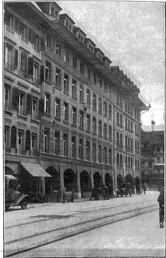
Das neuerstehende Bern. Das Karl Schenk-Haus an der Spitalgasse, welches an der Stelle der abgerissenen Häuser Nr. 6–12 erbaut wurde.

Das Karl Schenk-Haus und das ebenfalls neu erstellte Hinterhaus an der Neuengasse bildet mit seiner ins Kleinste ausstudierten Raumaussnutzung, seinen modern-