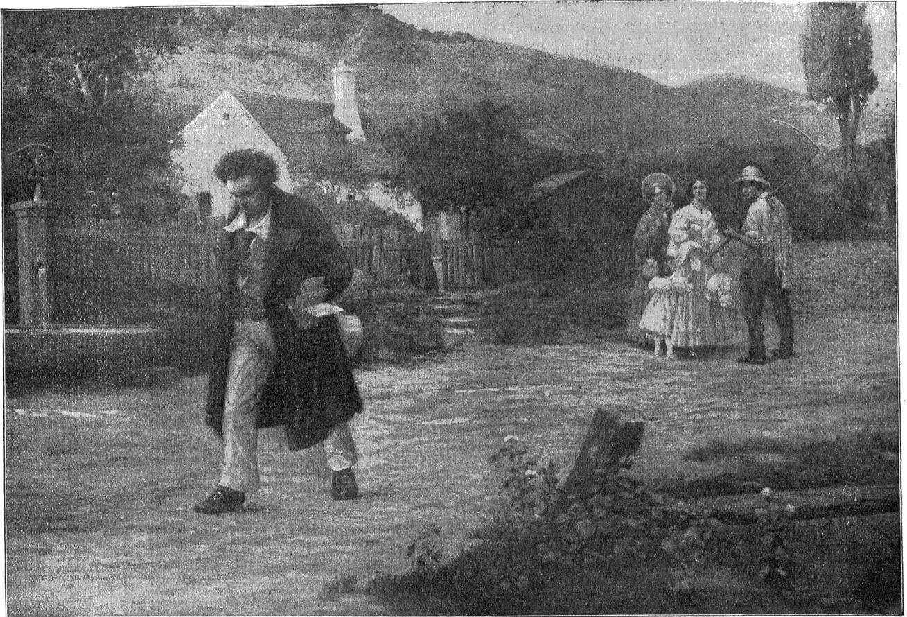
Der einsame Meister. — Nach einem Gemälde von Otto Nowak. (Zum Beethoven-Artikel.)

zu leben! Es gibt heute ein mächtiges Volk, das über alle andern Völker sich erhoben hat und alle ausplündert. Und sein Herr, der über alle gebietet, tut in seinem Uebermut Gewalttat und Frevel. Doch tausendmal schlimmer als das große Kriegsvolk des Kaisers werden die Menschen sein, die in ihrer Sicherheit Gott vergessen haben!“