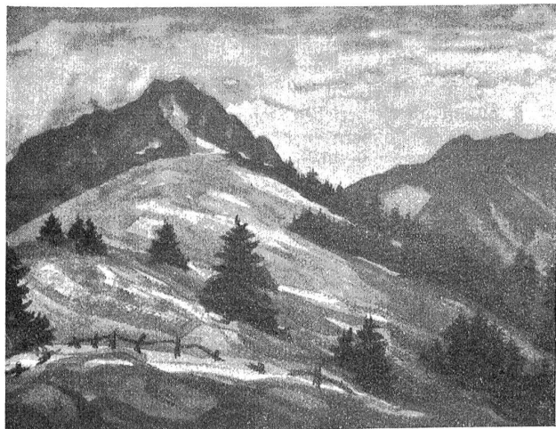
Walter Krebs: Im Schwefelberg.

erkennen. Das gilt auch für Walter Krebs. Die Bilder, die er in Bern vor kurzem ausstellte, sind noch nicht Erfüllung, sondern bloß Verheißung. Sie zeigen eine ganz ursprüngliche Begabung für die Landschaftsdarstellung und