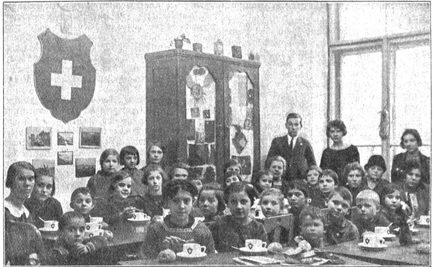
Schweizer Jugendhort in Budapest. Schweizerkinder beim Abendbrot. Leider reichen die Mittel nicht aus zur täglichen Bewirtung.

Als beliebte Anlässe haben sich die Exkursionen unter fachmännischer Führung erwiesen. Es werden dieses Jahr die Gemüsekulturen bei Rezzers und das Wistenlach, bekanntlich unser Zwiebel-land, besucht. Ferner eine Obstplantage bei Neuenburg, dann die dem baldigen Untergang geweihten originellen Anlagen der canadischen Baumschule in Wabern, eine Blumengärtnerei u. a. m. Das gartenfreundliche Publikum wird auf die Tätigkeit der Bernischen Gartenbau-Gesellschaft aufmerksam gemacht. Auskunft