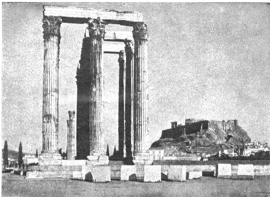
Olympion und die Akropolis bei Athen. (Phot. Boissonnas, Genf.) (Aus „Hellas“ von Dr. Hans Bloesch, im Eugen Rentsch-Verlag, Erlenbach bei Zürich.)

wärts, und wenn sie mit festem Griff die schlechtgegründeten Kleider hochrüdten oder im Vorbeihasten angestoßen wurden, fühlte man deutlich, daß sie voll Träg und Widerstand waren.