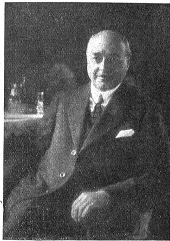
† Adolf Diehl-Günter.

Adolf Diehl wurde zu Bern geboren, den 27. Dezember 1865. Sein helles