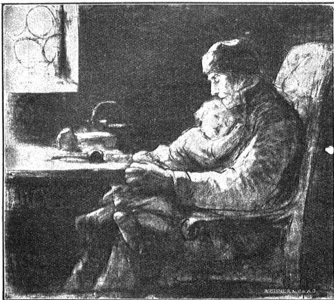
H. Anker: Mittagsruhe.

Heinrich glaubte in seiner weinseligen Stimmung, wirklich nun den Schlüssel zum bessern Fortkommen gefunden zu haben. Aber als er am Morgen früh zusehen mußte, wie Rollers Knecht David seine Kuh und die zwei Rinder über die Straße nach dem Röhlistall hinübertrieb, war es ihm zumute, als ob er an dem Viehlein ein Verbrechen begangen und nun zur Strafe dafür den Boden unter den Füßen verloren hätte. Dennoch verhinderten ihn Trotz und Eigensinn daran, den Handel rückgängig zu machen, was bei einigem guten Willen wohl noch zu erreichen gewesen wäre. Er saß den ganzen Tag im Wirtshaus, zahlte jedem, der hereinkam, eine Flasche Wein, und prahlte in launiger Weise, er habe es nun heraus, wie man Schulden in bares Geld verwandeln könne. Am späten Abend aber hockte er wohl eine Stunde lang bei geschlossener Tür auf dem Melkschemel in seinem leeren Stall, studierte und weinte zwischen hinein wie ein kleines Kind.