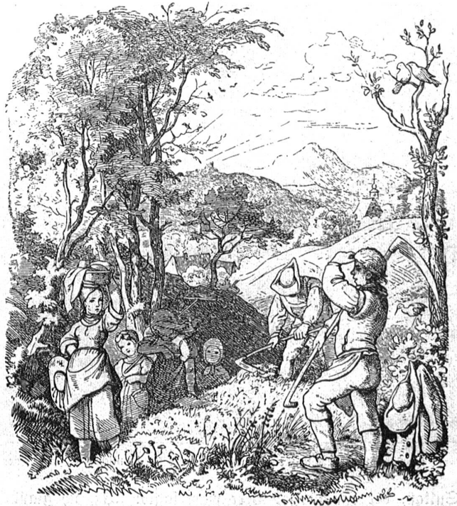
Der Morgenstern. Von L. Richter.

Gewinn. Das ist aber auch ziemlich das ganze literarische Werk des Dichters. Ein Beweis mehr, daß nicht die Breite, sondern die Tiefe den Wert bestimmt. H. B.