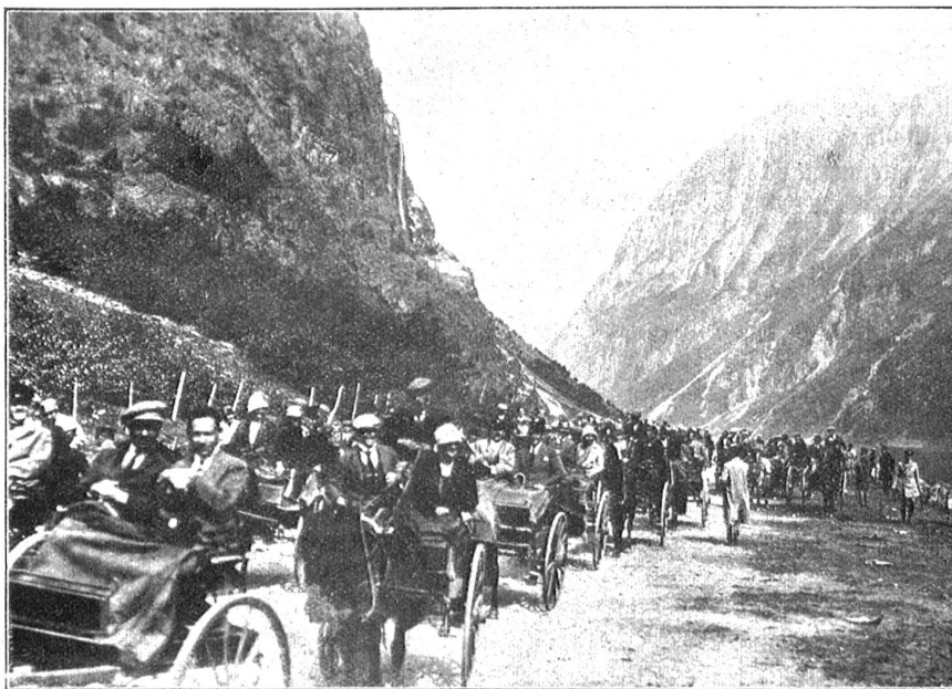
Die Schönheiten des Nordens. — Die Gäste des Norddeutschen Lloyd auf der Fahrt durch Narodol.