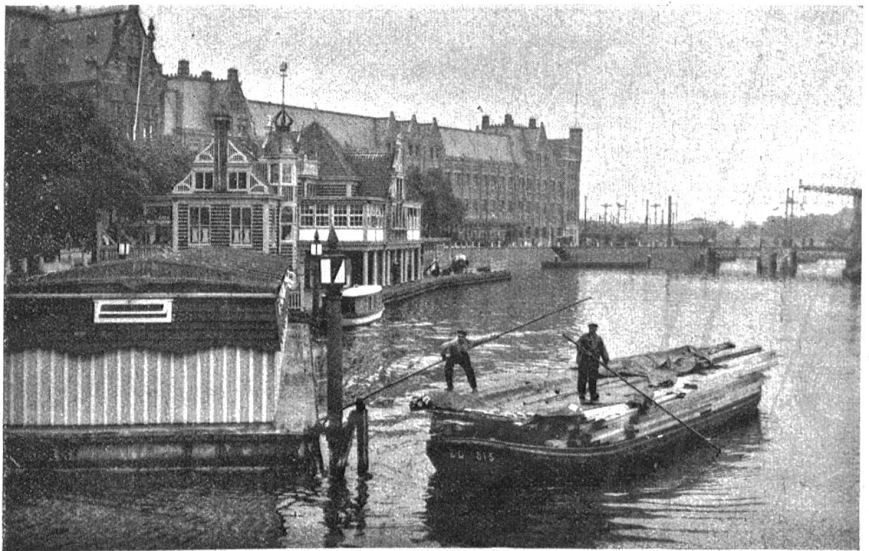
Amsterdam. — Beim Bahnhof.

Am nächsten Morgen brachten wir dem Schweizerkonsul,