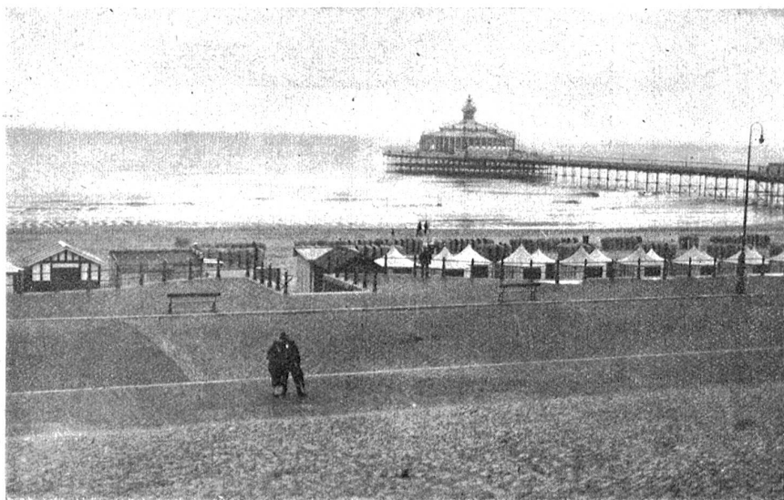
Scheveningen. — Nordseebad.