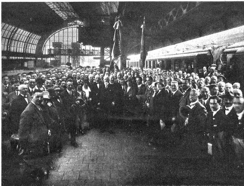
Der Empfang in Amsterdam.