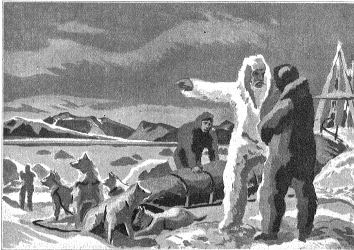
Nansen machte seine Polarreise ohne Alkohol.

Unser Gedankengang ist keine Fiktion; er ist bestehende und werdende Wirklichkeit.