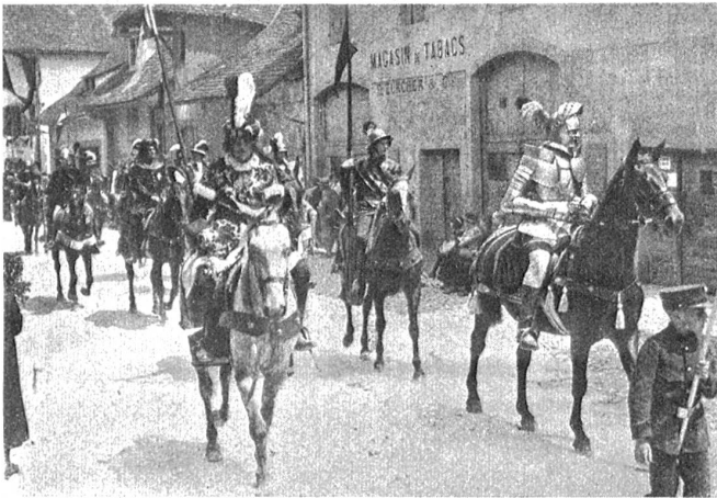
Seftzug: Adrian von Bubenberg, der Verteidiger von Murten (links); J. R. von Erlach (rechts); Knappen.