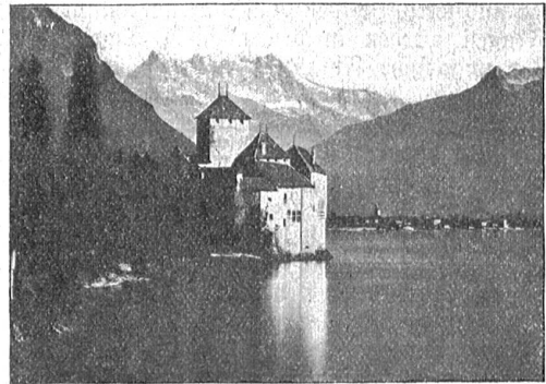
Schloß Chillon bei Montreux.

unserer Regenwetterperiode hatte die Festsauflührung am Sonntag nachmittag. Sie war vom besten Wetter begün-stigt und nahm den besten Verlauf; die Tribünen waren