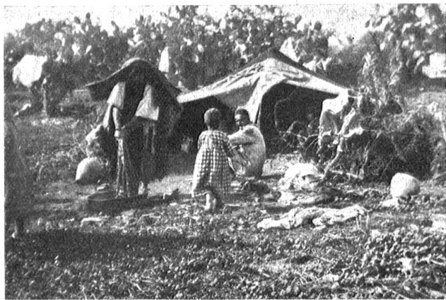
Beduinenzelt in der Umgebung von Sidi Bou Saïd.