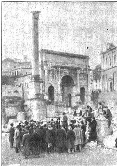
Ein Sonntagnachmittag im Forum Romanum.

Um die Jahreswende fand in Rom die feierliche Amtseinführung des neuen Stadtgouverneurs statt, bei welchem Anlaß das gesamte Kabinett und der Ministerpräsident anwesend waren. Mussolini hielt eine begeistert aufgenommene Ansprache, in der er in großen Zügen die Ziele und Bestrebungen der neuen Gemeindeverwaltung darlegte. Ganz besonders wies er hin auf die Bautätigkeit in der Stadt, auf die Erstellung neuer Straßen, verbesserter Verkehrsmittel, neuer Schulen, Parkanlagen, Gärten u. und gab dabei der Hoffnung Ausdruck, daß die alten Stadtteile, die Zeugen einer längst verschwundenen Kultur, geschont werden mögen. Er sagte unter anderem, daß Rom in den nächsten fünf Jahren so umgestaltet werden müsse, daß es allen Völkern der Welt als etwas Wunderbares, Gewaltiges, Großes erscheine, wie es in der Zeit des ersten Kaiserreiches Augustus war. Alle verunstaltenden Neuerungen, entweichenden Bauten müssen verschwinden, so daß alle vorchristlichen Zeugen der römischen Geschichte, wie auch die prachtvollen Tempel des christlichen Rom wieder sichtbar