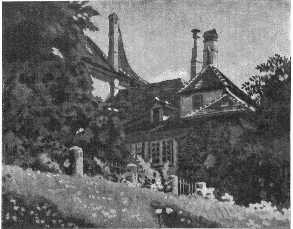
Schloß Bolligen. Nach einem Gemälde von Fritz Volrol, Zürich.

„Ich weiß nicht, was das bedeuten soll“, sagte sie, das Tuch wegwerfend. „Aber was ist das, worüber Sie sich gewundert haben? Reden Sie offen, Lisette, wie sich's gehört!“