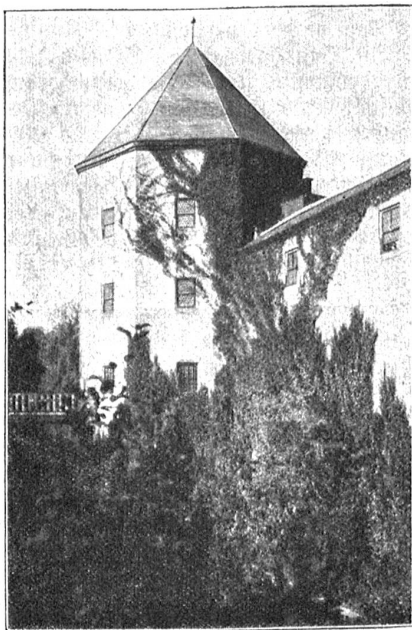
Turm der Gösbenburg in Jagsthausen. (Die Brücke links fährt über den Burggraben.)

Sie konnte mich auch nicht verlassen. Sie war meine Amsel. Und wenn ich an Freunde zu schreiben hatte, so redete ich in meinen Briefen von ihr und nannte sie mein. Ich kam auf den Gedanken, daß es vielleicht so mit jeder Besitzergreifung bestellt gewesen sei. Der Armenisch klammerte sich an das, was er liebte, nannte es schließlich sein, glaubte, daß es sein wäre und erschlug endlich den, der es ihm bestritt. Ob es sich nun um eine Höhle, ein Stück