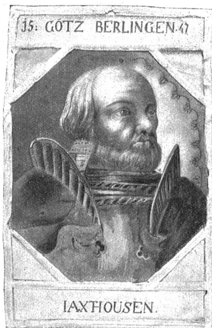
Gemaltes Fenster mit dem Bild Götz von Berlichingens.

Welch heitere Sinneswelt, welch glückliches Verweilen, Genießen in der sonnigen Gegenwart!