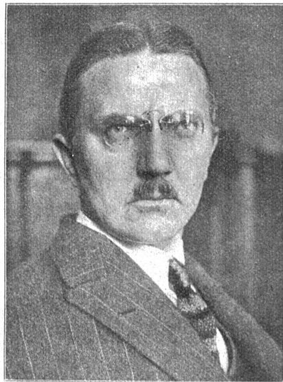
Dr. Hjalmar Schacht, der Direktor der deutschen Reichsbank, Träger der Deflationspolitik, die die gegenwärtige Wirtschaftskrise gebracht hat.

Warschau wird mit dieser Lösung kaum ganz zufrieden sein. Es droht auch schon mit der Abkehr von Genf und mit Anlehnung an Moskau, das natürlich mit freundslichem