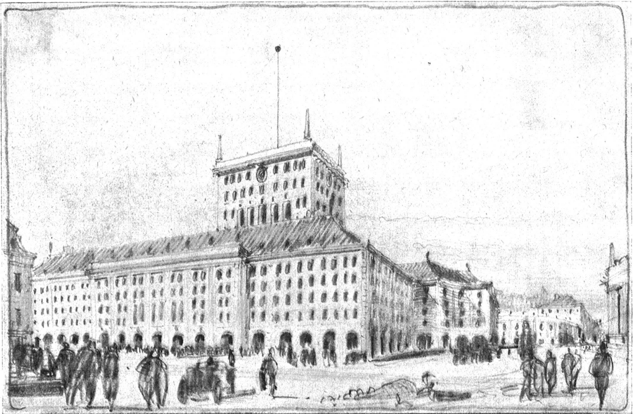
Neuer Bahnhof Bern. — Projekt Liechty b. Perspektivische Skizze.

Erstellungskosten des Bahnhofgebäudes rund 2,500,000 Franken; Erstellungskosten des Geschäftshauses nach Projekt (a) rund Fr. 2,500,000; Erstellungskosten des Geschäftshauses nach Projekt (b) rund Fr. 8,000,000.