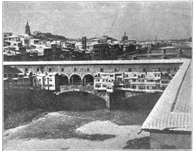
Abnorme Kälte und Schnee in Italien (vor ca. 14 Tagen). In Florenz hat die Kälte acht Grad unter Null erreicht. Das Bild zeigt einen Überblick über die „Ponte Vecchio“ und den zugefrorenen Arno.

Mehr als wir Schweizer trägt der Deutsche in sich die Sehnsucht nach dem Lande Tassos und Dante Alighieris.