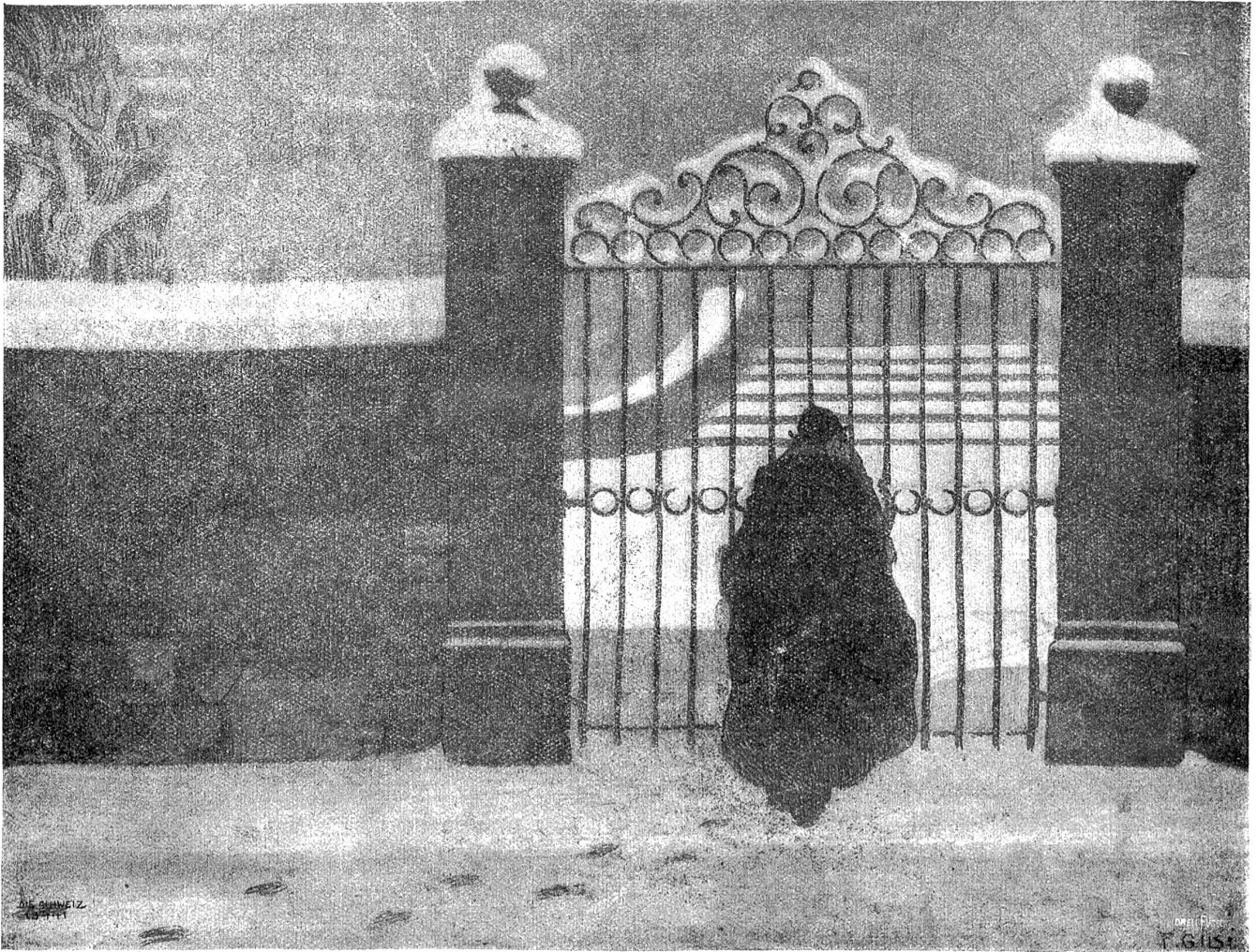
S. Gils: Der Bettler am Tore.

Unruhen der Liebe und von ihrer absurden Abhängigkeit von dem geliebten Gegenstand nicht inkommodiert werden. Sie sollte einen Gatten aus ihrer, Tante Ursulas, Hand annehmen. Diesen Gatten zu finden, wollte sie es sich anlegen sein lassen. Wohlverstanden, zu seiner Zeit.