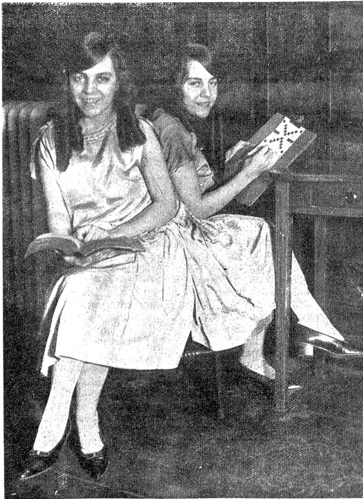
Zwei hübsche Engländerinnen — „Siamesische“ Zwillinge. Daisy und Violet Hilton, 16 Jahre alt, sind die einzigen „Siamesischen“ Zwillinge unter englisch sprechenden Völkern. Sie interessieren sich sehr für den augenblicklich sehr modernen Zeitvertreib „Rätselraten“. Die eine ist mit dem Rätsel beschäftigt, die andere mit dem Wörterbuch. Die Zwillinge sind in England geboren; sie leben in San Antonio (Texas) und halten sich gegenwärtig in New-York auf.