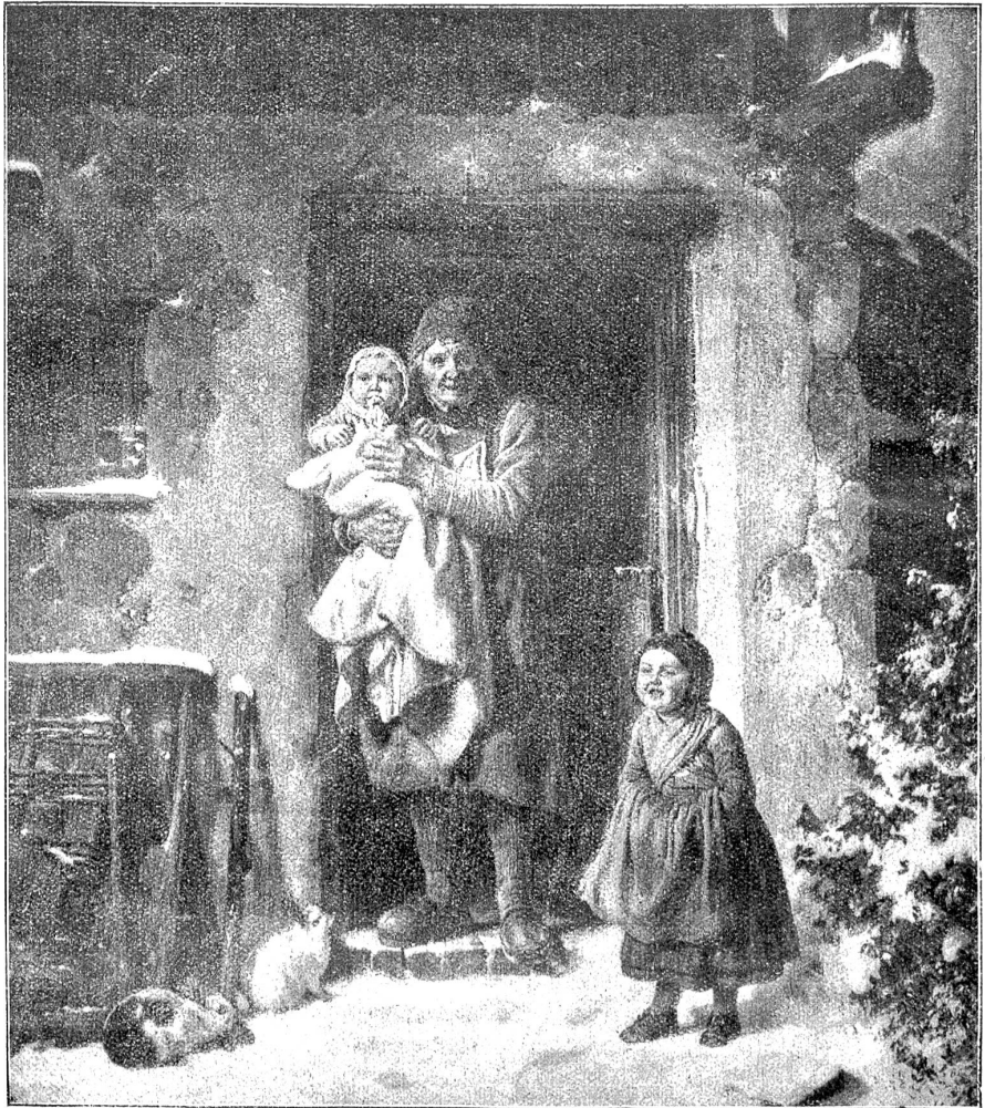
Sr. Bischoff: Erster Schnee.

Die Berene sei eine feine Magd, berichteten sie weiter, als sie von Tante Ursula nichts mehr wußten. Ein jedes, das ihr in der Küche einen Besuch mache, bekomme Rannenbirnenschnitz. Und sie habe in ihrer Stube ein russisches Österei, ganz aus Wachs, mit Bildchen darauf, blauen und roten. Das sei heilig, habe die Berene gesagt, aber nur für die Katholischen, die Protestantischen verstünden nichts