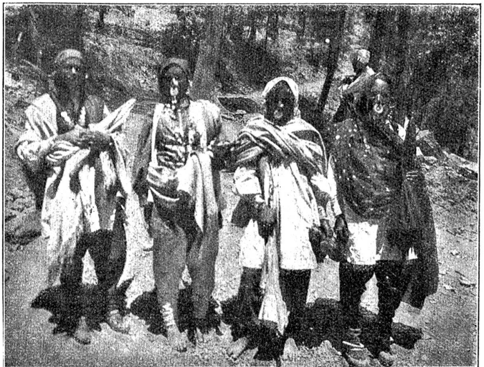
Pahari-Frauen im Festgewand

D'Wält isch überhoupt schütteleh chly und überall findet me Sache, wo me gmeint het, di syge nume imene ganz bsundere Egge vom Globus deheim. Stierkampf als regelmähigi Volksbelustigung hätt i emel niene anders hi ta als nach Spanie. Aber si sy hie grad so druf verjässe wi dert. Ei Tag hei di hiesige Bärger, me seit ne „Bahari“, uf enere große Matte zmitts im Wald es Feschtli gha. 3'Hunderte wys sy si ringsum gsässe. D'Froue i irem schöne Gostüm, dunkli Hose, es farbigs Hemmli, drüber es Gilet und ume Chopf entweder e luschtige Naselumpe oder es längs Echarpe, das sie gar graziös wüsse zrüggschlah.