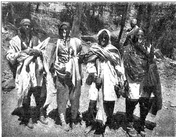
Pahari-Frauen im Festgewand

D'Wält isch überhoupt schütteleh chly und überall findet me Sache, wo me gmeint het, di syge nume imene ganz bündere Egge vom Globus deheim. Stierkampf als regelmähigi Volksbelustigung hätt i emel niene anders hi ta als nach Spanie. Aber si sy hie grad so druf verjässe wi dert. Ei Tag hei di hiesige Bärger, me seit ne „Bahari“, uf enere große Matte zmitts im Wald es Feschtli gha. 3'Hunderte wys sy si ringsum gsässe. D'Froue i irem schöne Gostüm, dunkli Hose, es farbigs Hemmli, drüber es Gilet und ume Chopf entweder e luschtige Naselumpe oder es längs Echarpe, das sie gar grazios wüsse zruggschlah.