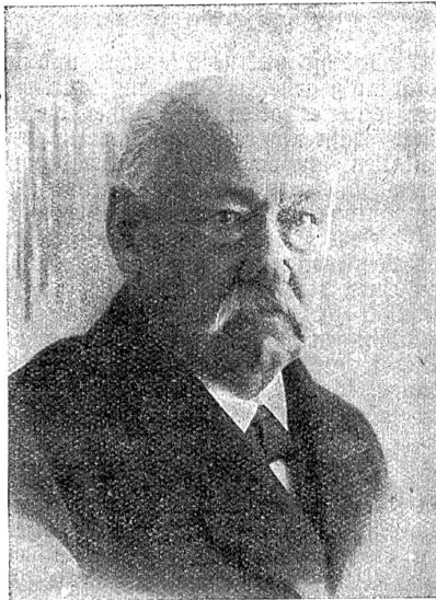
† Landammann Eduard Blumer.

zen Kraft für die Revision der kanto-nalen Verfassung ein, wie er später auch vor der Landsgemeinde die Steuerrevi-sion mit Progression verfocht. 1877 kam er in den Ständerat, 1900 in den Na-tionalrat, den er 1920 als 72jähriger