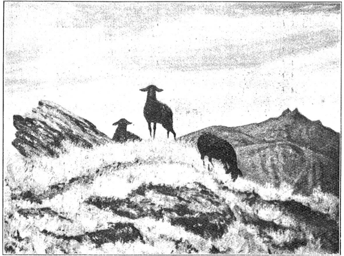
U. W. Züricher. — Auf freier Höhe.

U. W. Züricher geht in seinen Bildern ganz offenkundig vom Erlebnis aus. Und zwar führt er uns schlicht