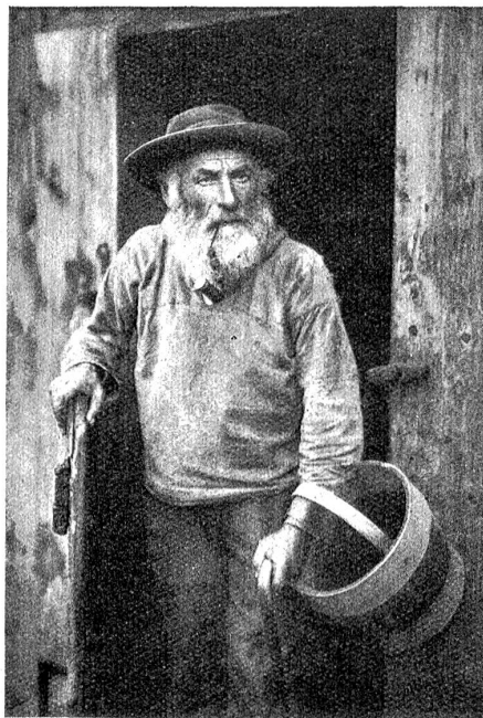
Ein wahrhafter Schächentaler.

Ähnlich erging es mit den älteren Schongesetzen für Gemsen und anderes Großwild. Selbst das Raubwild war