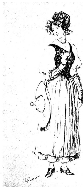
Waadtländerin in ihrer Tracht.

Besondere Beachtung verdient die Gruppe Obst- und Weinbau. Ebenso der Pavillon über Bienenzucht. Die rührenden Beileger aus allen Gauen unseres Landes bieten mit viel Geschmaç ihr Bestes. Einen mächtigen Eindruck hinter-